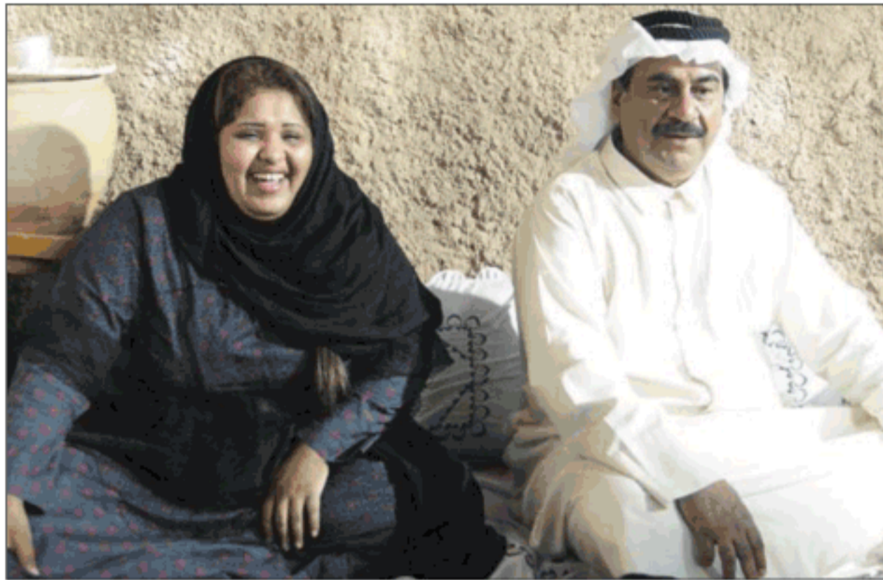
لقطة من المسلسل

لا أتابع أعماله وأحب أن أسمع صداها من الناس المتابعين وأرى نتائجها من خلالها سواء مدحاً أم نقداً