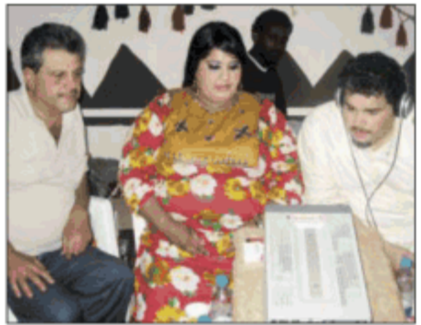
متابعة لآخر المستجدات

وجود الأخ التي يؤديها الفنان أحمد السلطان وهو عمل كوميدى مو طبيعي ويذكرنا بالفنان الكوميدي حياة الفهد وسعاد عبدالله. • نأتمنا تلاحقنا من هناك خروجا في نفس المسرحي وخاصة في المجال الكوميدي؟ ■ لا بد منها لأن للممثل الكوميدي لا يتقبل بالنص لأنه يحس أن هناك أشياء لابد أن يعملها وانطلاق في الحوار والحركات وأنا لا اتقيد بالنص المسرحي ولا أحب أن التقيد.