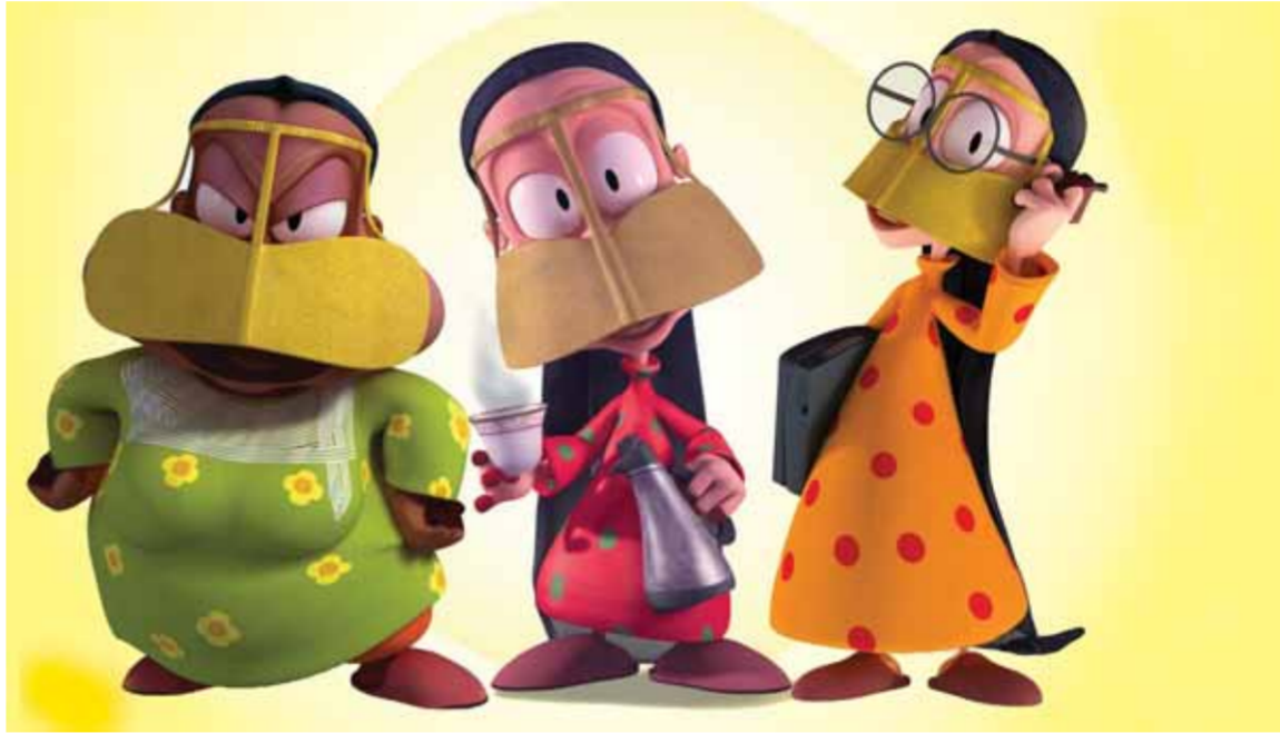
• «فريج».. نموذج لكارتون الكبار