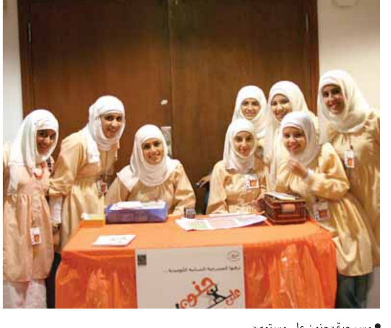
• مسرحية «جنون على مستوى»